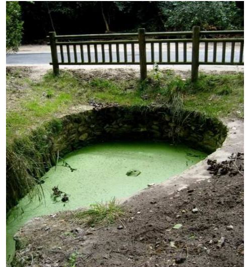
Figure 1: Source Rivière Ecole au Vaudouè

Sur le territoire de notre commune, nous la voyons au sud comme un cours d'eau tranquille. Mais en aval du moulin de la Fosse, la rivière a creusé une gorge,