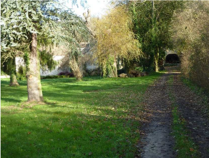
Figure 5: Le Moulin de la Fosse

L'École a longtemps été pour nos aïeux un pôle économique important. Productrice d'énergie, elle faisait tourner, tout au long de son cours, une vingtaine de moulins. A Saint-Sauveur même, deux moulins à grain ont fonctionné jusqu'au début du siècle dernier, et leur production s'exportait fort loin, puisqu'on a identifié des clients aussi bien à Villejuif qu'à Guignes-Rabutin. Leur