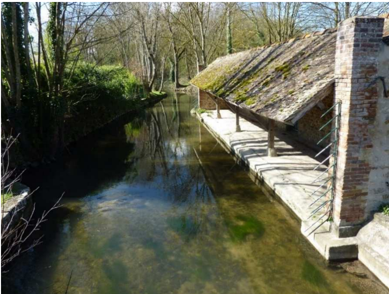
Figure 6: Le Lavoir d'Étrelles

origine est fort ancienne puisqu'ils figurent dans un règlement de 1369, et leurs bâtiments existent toujours : le moulin d'Étrelles est situé juste à l'entrée de la rivière dans la commune, et le moulin de la Fosse est à 500 m en aval du premier.