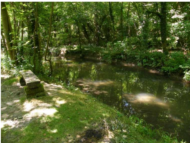
Figure 2 : L'Ecole à La Planche-Coutant

profonde de 32 m, dans le calcaire de Champigny. On observe bien ce passage encaissé et ses versants boisés au lieu-dit la Planche-Coutant. En aval, la rivière alimente des étangs abritant de nombreux oiseaux d'eau, sédentaires ou de passage.