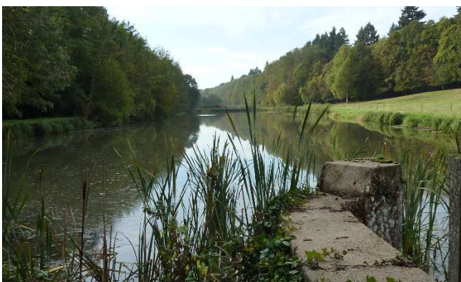
Figure 3 Les Etangs

profonde de 32 m, dans le calcaire de Champigny. On observe bien ce passage encaissé et ses versants boisés au lieu-dit la Planche-Coutant. En aval, la rivière alimente des étangs abritant de nombreux oiseaux d'eau, sédentaires ou de passage.